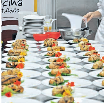
Cocina para todos: qualité et amour du détail