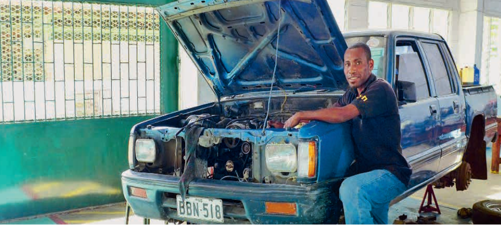
Au DBTI, les jeunes apprennent différents métiers techniques, comme p.ex. mécanicien automobile