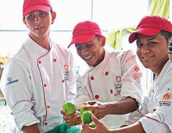
Trois apprentis préparent des boissons