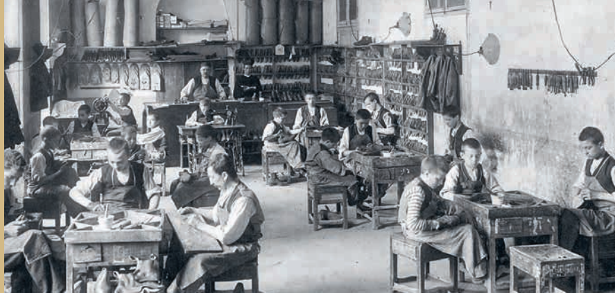
Aperçu d'une journée de travail ordinaire dans une cordonnerie à Turin, autrefois