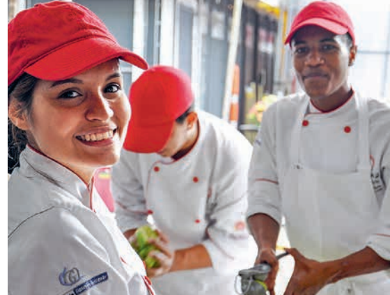
Les jeunes sont fiers de leur formation