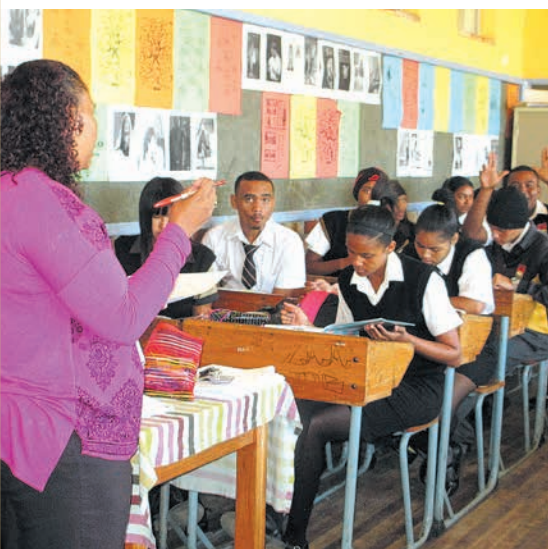
Pour les jeunes des Townships du Cap, Salesian Life Choices ouvre la voie vers une vie meilleure

18 ans après la fin de l'apartheid, 59% de la population en Afrique du Sud n'ont toujours aucune formation ou une formation secondaire lacunaire. Dans les Townships, les quartiers pauvres du Cap, ce pourcentage est encore plus élevé. Le manque d'accès à la formation et aux services de santé empêche les gens de sortir du chômage omniprésent et de la pauvreté. Ce sont surtout les jeunes qui souffrent de ce manque de perspective.