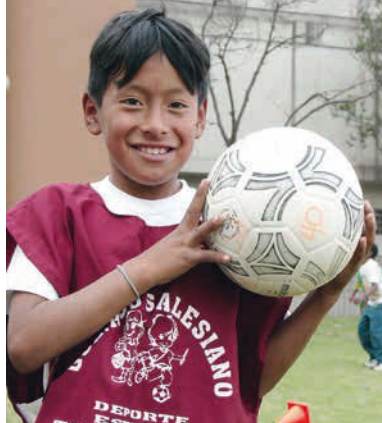
L'amour pour le football permet d'éloigner les enfants de la rue, progressivement