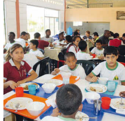
Les centres pour enfants des rues proposent aussi des repas