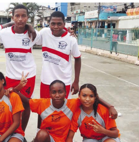
garçons et constituent le premier pas pour les éloigner de la rue

L'objectif du programme Chicos de la calle est d'éloigner les enfants de la rue et de les réinsérer dans la société. Outre un abri, de la nourriture, de la formation et une prise en charge personnelle, cela nécessite également un changement de la structure familiale. Car cette dernière contribue de manière déterminante au fait que les enfants vivent dans la rue – que ce soit pour cause de pauvreté, de violence ou d'abus.