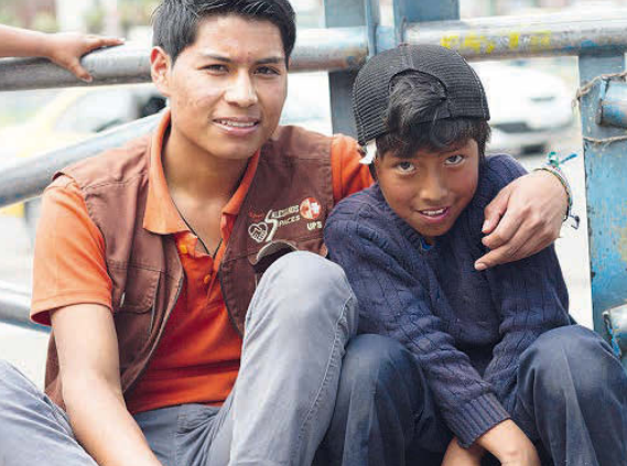
Des travailleurs sociaux abordent les enfants dans la rue et instaurent la confiance