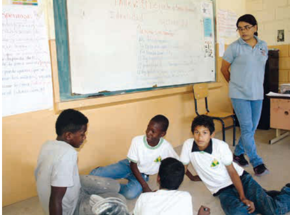
Les Salésiens et les travailleurs sociaux motivent les enfants et les persuadent d'aller régulièrement à l'école