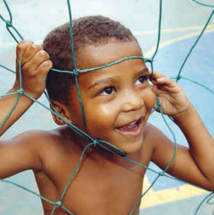
Le football – un pont entre la rue et l'école