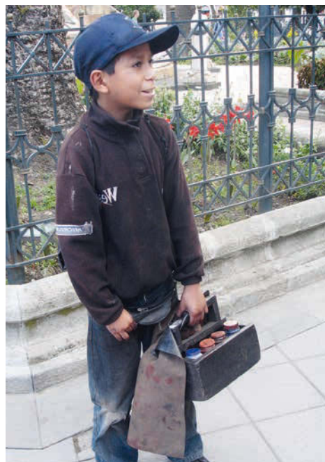
En cirant des chaussures, les enfants gagnent quelques cents pour survivre

Aide à la jeunesse mondiale de Don Bosco