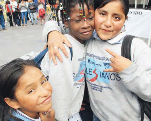
Le football encourage également des compétences sociales : fairplay, esprit d'équipe et gestion des conflits