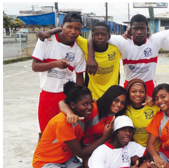
Les écoles de football de Gol.A.S.O. séduisent autant les filles que les

Dans sept villes de l'Equateur, les Salésiens s'occupent de 5000 enfants des rues