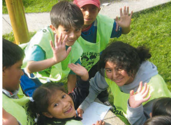
Outre le football, l'entraînement leur apprend à respecter des règles et à retrouver une journée structurée