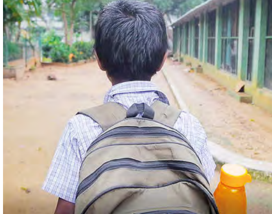
L'aide aux devoirs et les cours de soutien permettent de suivre en classe