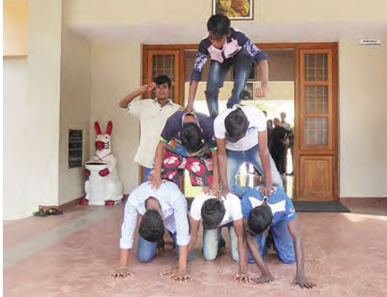
Le jeu et le sport favorisent la cohésion et le sentiment d'appartenance