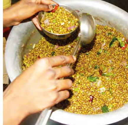
Une alimentation saine et complète est importante pour le bien-être