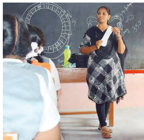
L'utilisation des produits d'hygiène menstruelle ne s'improvise pas