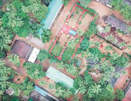
Vue aérienne du centre Don Bosco