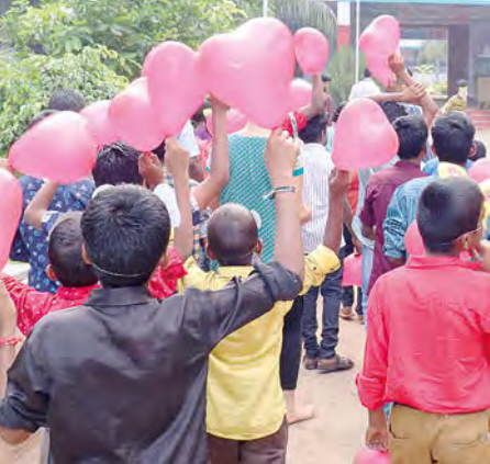
Faire la fête, ça fait du bien à l'esprit et à l'âme