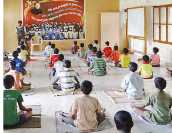
Dans nos workshops, nous abordons et discutons aussi de sujets tabous