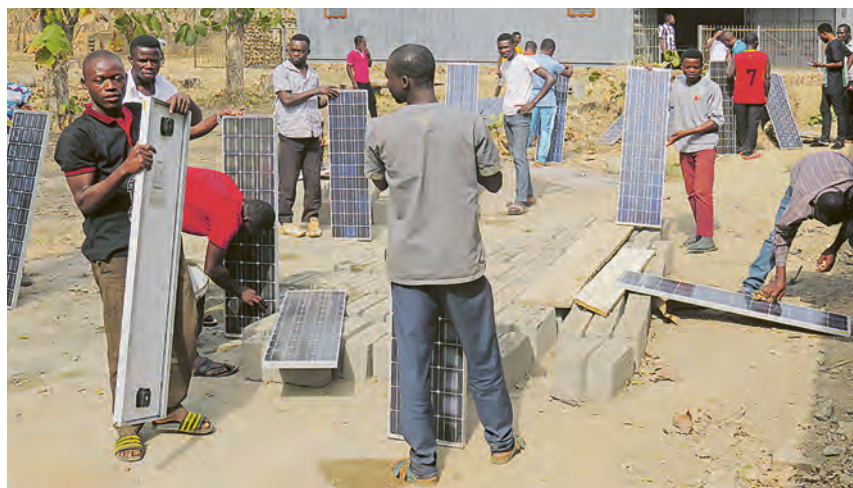
La pratique est enseignée sur des modules individuels

« Une formation de qualité, tournée vers l'avenir, crée des perspectives pour la vie »