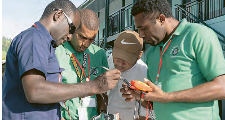
Haute concentration pour tester le bon fonctionnement