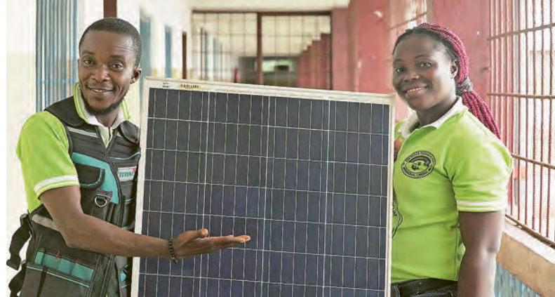
« Mettre la main à la pâte », c'est un élément important de la formation