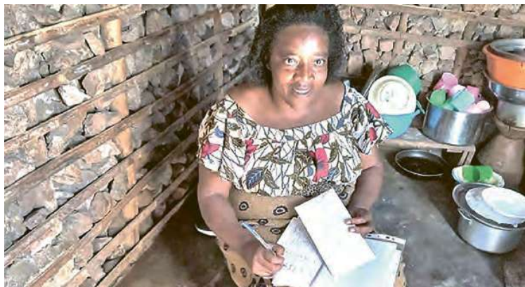
Des mères sont formées au micro-entrepreneuriat