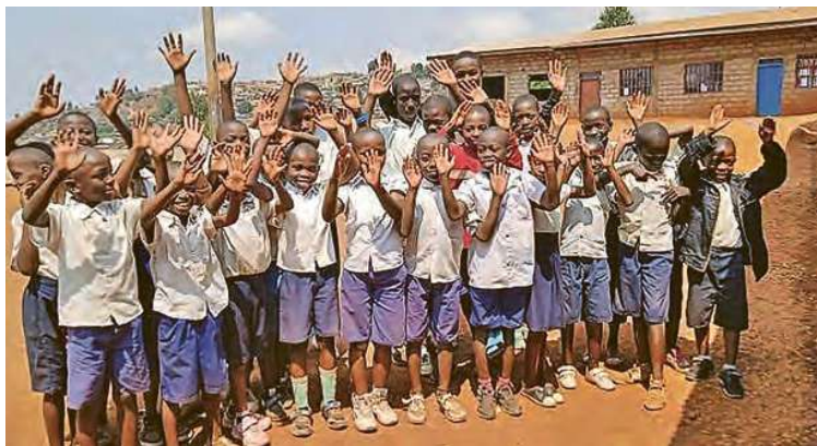
Des enfants vont à l'école grâce aux Salésiens de Don Bosco