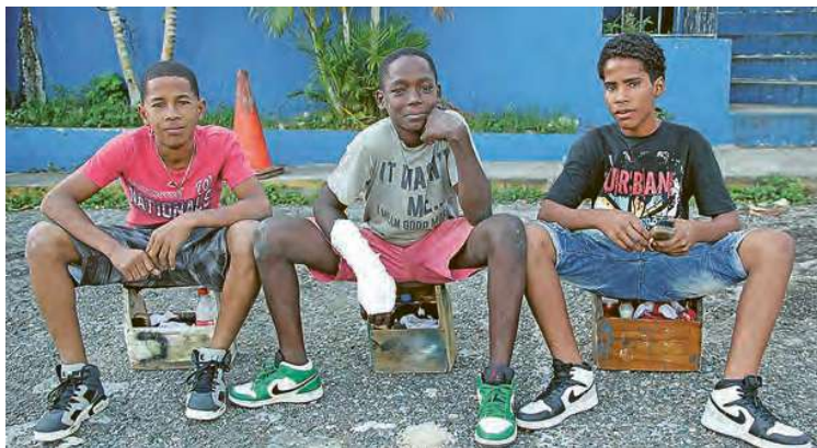
Les garçons contribuent au revenu de la famille en travaillant comme cireurs de chaussures