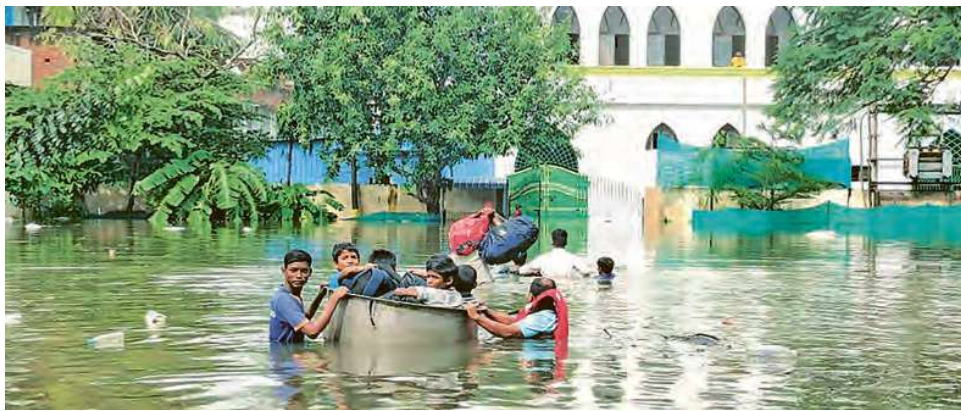
Dans la mégapole Chennai, d'anciens enfants des rues sont évacués du centre inondé Don Bosco Anbu Illam