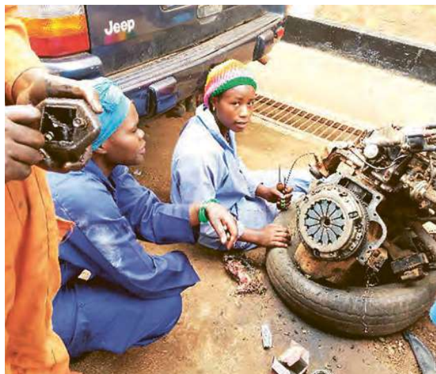
Les femmes sont porteuses du changement – la formation renforce leur position au sein de la famille et de la société. Elles se rendent compte de l'importance de l'éducation pour leurs enfants