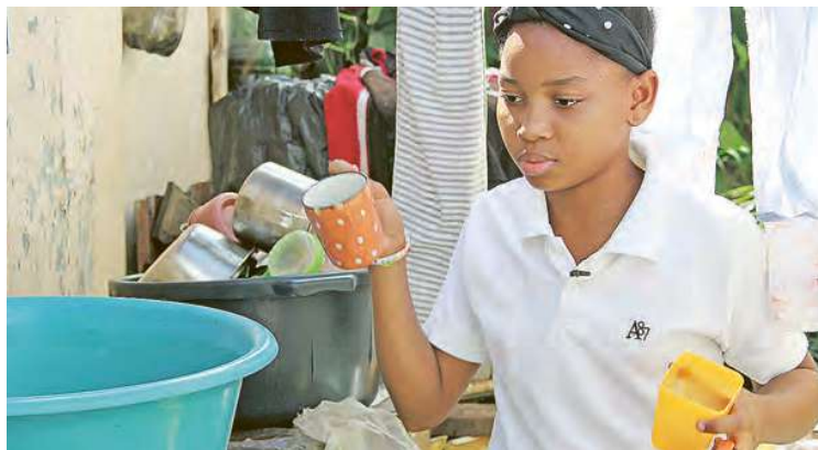
Les filles mènent souvent une vie cachée en tant qu'aides ménagères