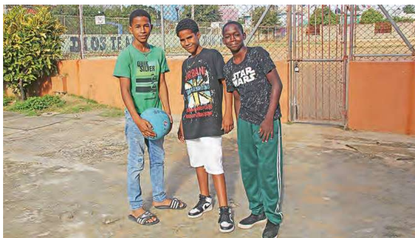
Les enfants des rues sont les bienvenus et pris en charge à la Casa de Canillita

« Les enfants doivent pouvoir être des enfants pour déployer tout leur potentiel »