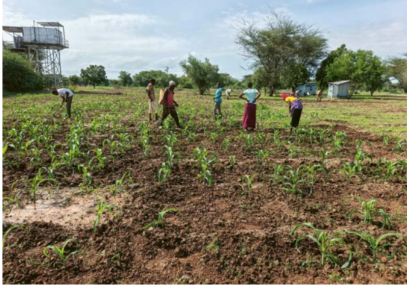
Landwirtschaftskenntnisse für das Leben

Die Ernten werden im Flüchtlingsdorf verkauft, stärken die lokale Versorgung und schaffen kleine, aber wichtige wirtschaftliche Kreisläufe. Händlerinnen und Händler profitieren, Familien erhalten Zugang zu frischen Lebensmitteln, neue Einkommensquellen entstehen. Doch vielleicht ist der grösste Wandel nicht sichtbar. Er zeigt sich in den Menschen selbst.