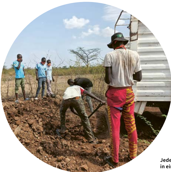
Jeder Spatenstich ist ein Schritt in ein selbstbestimmtes Leben

Die Farm selbst ist zugleich Ort des Lernens und des Lebens. Hier wird mit Wasser gehaushaltet, mit der Sonne gearbeitet und im Einklang mit der Natur produziert. Gewächshäuser, Bewässerungssysteme und nachhaltige Anbaumethoden helfen, den Herausforderungen von Trockenheit und Klimawandel zu begegnen. Dabei zählt jeder Tropfen Wasser, jede Pflanze, jeder Arbeitsschritt.