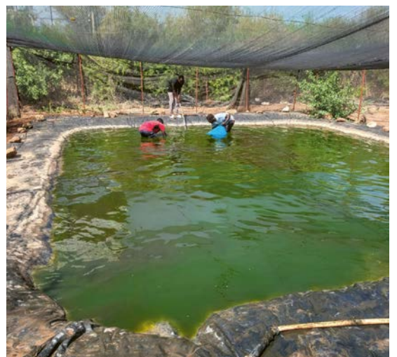
Bild oben: Mais ist in Kakuma ein wichtiges Grundnahrungsmittel Bild unten: Fischzucht für den Eigenbedarf