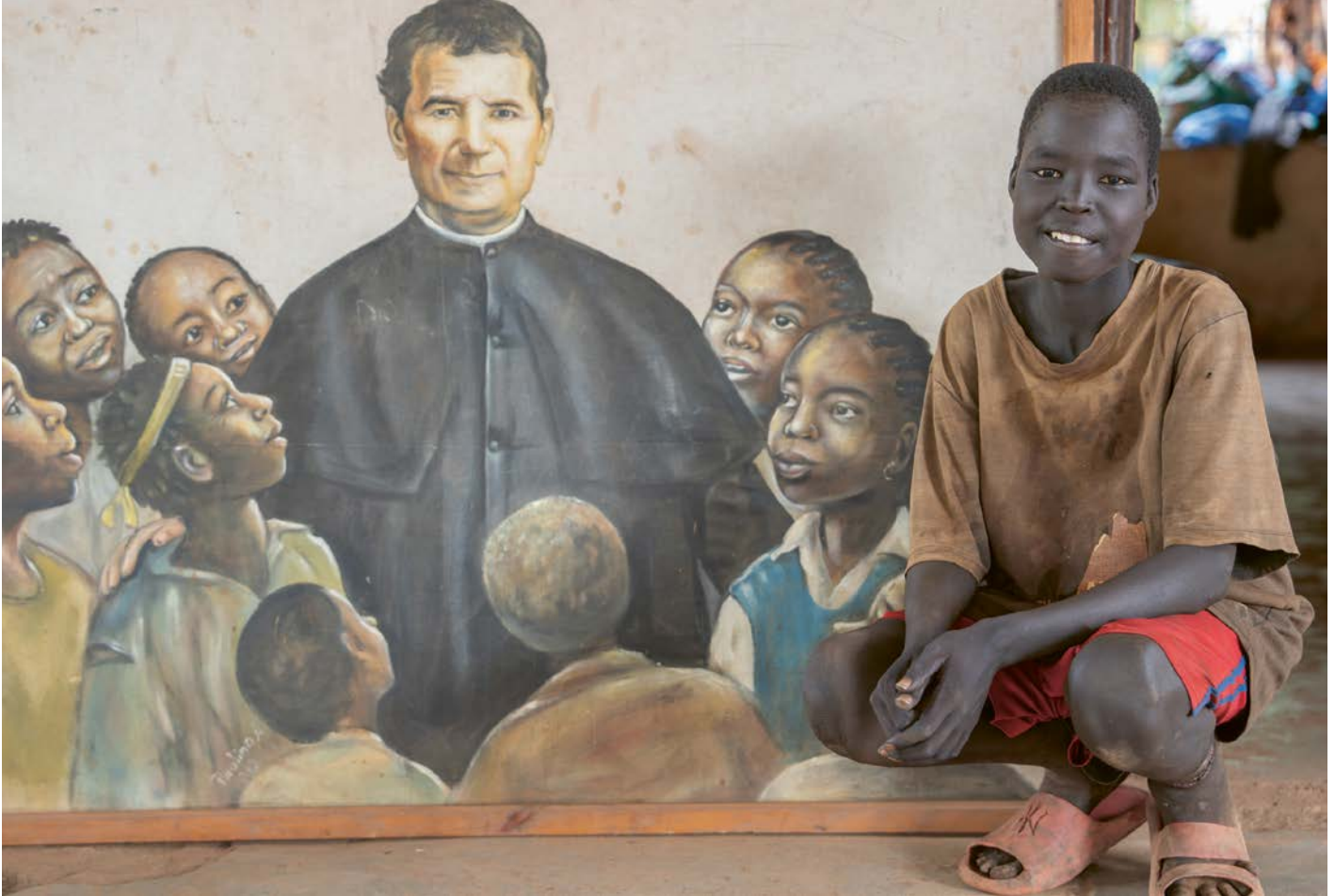
«Das Beste, was wir auf der Welt tun können, ist fröhlich sein, Gutes tun und die Spatzen pfeifen lassen.» Don Bosco

Unter dem Dach der Stiftung bietet sich eine überzeugende Alternative zu einer eigenen Stiftung. Sie richtet sich an Menschen, die sich nachhaltig engagieren möchten, dabei jedoch bewusst auf den Aufbau eigener Strukturen verzichten.